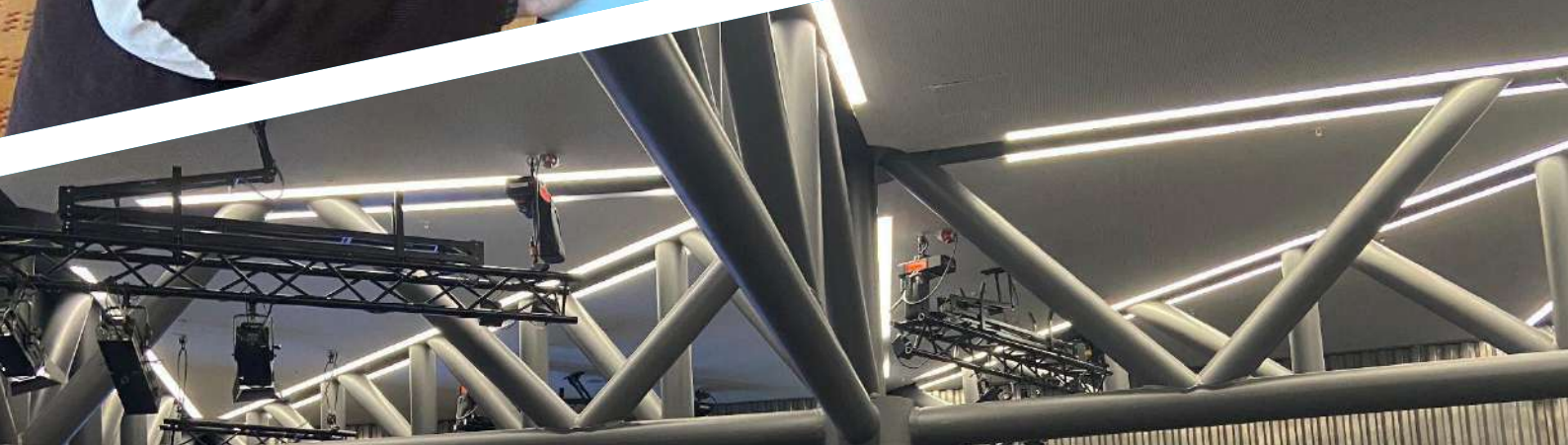
A assisté à la cérémonie de remise des prix du Geneva Challenge 2024, Geneva Graduate Institute