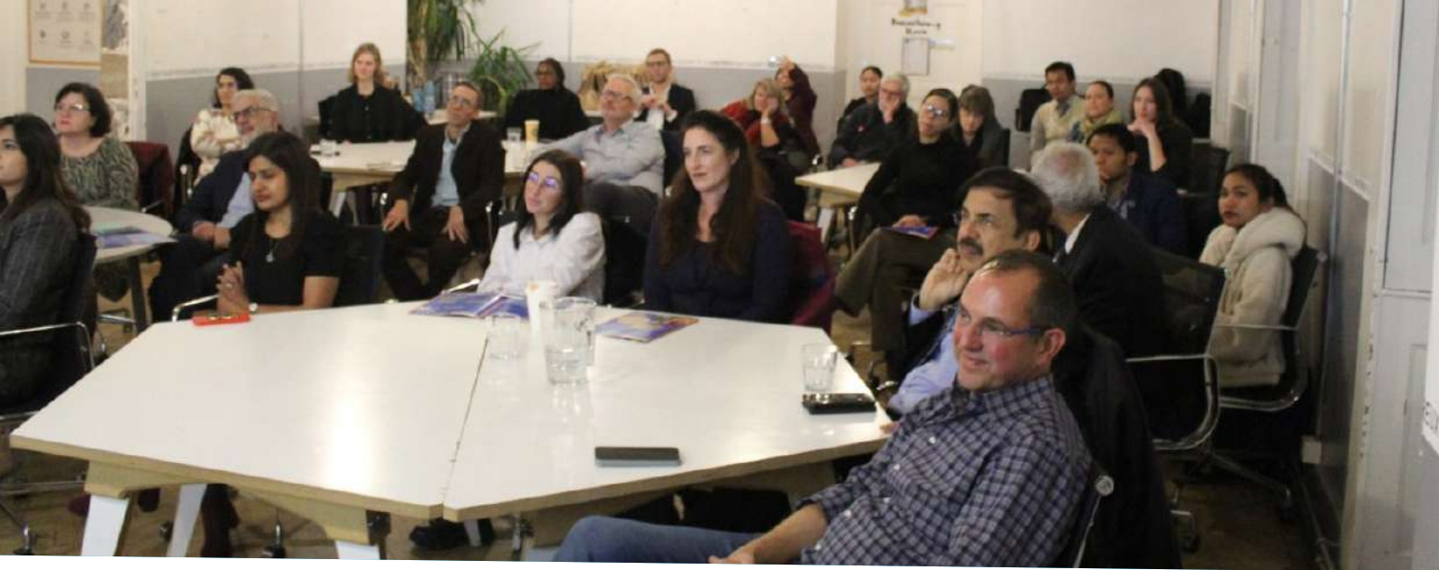
Réunion de l'assemblée générale, suivie d'un déjeuner en équipe